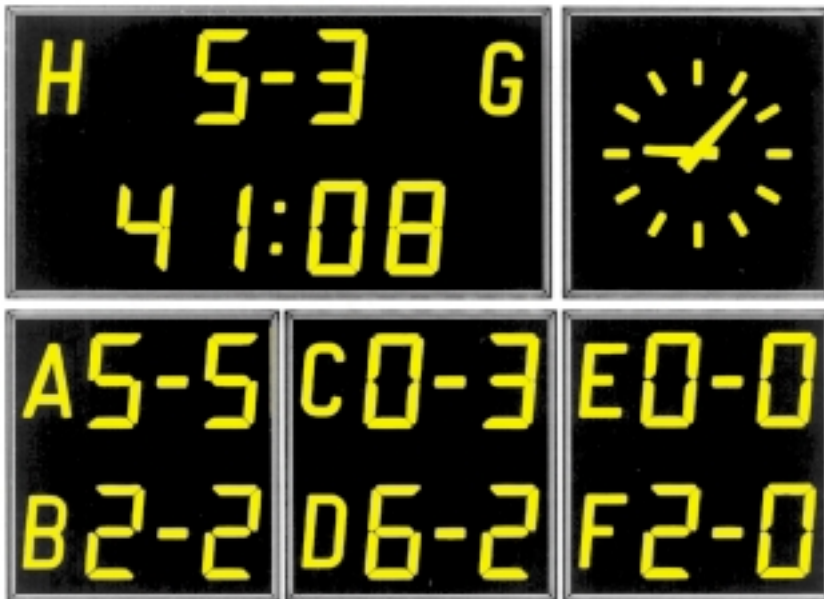
Resultattavla visande mål samt matchtid. Tilläggsmoduler för indikering av normalt看 (ur) och resultat från andra matcher

Westerstrand resultattavlor förser publik och deltagare med snabb, tillförlitlig och översiktlig information vid alla slags sportevenemang både inom- och utomhus.