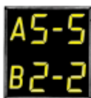
Modul F2 - Resultat 2 andra matcher Art.nr. 114942-00 Mått: 1.300x1.400x110 mm. Vikt: 42 kg.