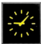
Modul F3 - Ur visande normalt看 Art.nr. 114946-00 Mått: 1.300x1.400x110 mm. Vikt: 35 kg. Timteckenkrans \varnothing 900 mm.