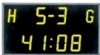
Modul F1 - Resultattavla Art.nr. 114940-00 Mått: 2.600x1.400x110 mm. Vikt: 80 kg.