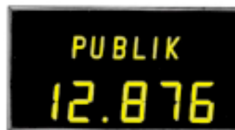
Modul F4 - Publik Art.nr. 114944-01 Mått: 2.600x1.400x110 mm. Vikt: 54 kg.