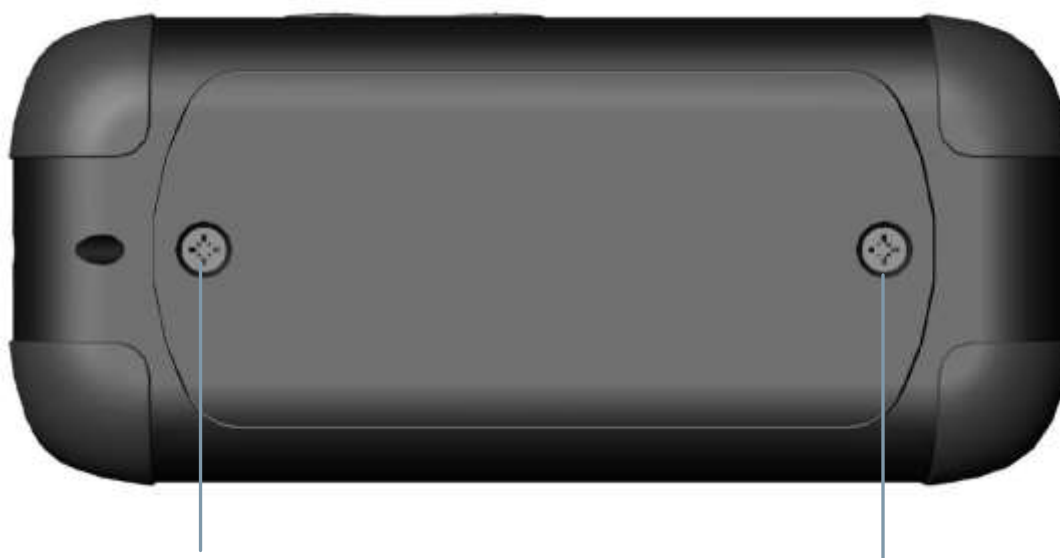
Låsskruv till batterilucka

Timstocken drivs av två AA-batterier. Batterier medföljer vid leverans. Dessa räcker för ca 60 timmars användning innan de behöver bytas. När lysdiodernas sken börjar avta ska båda batterierna bytas ut mot nya. Ta ur batterierna om du inte ska använda timstocken under en längre period.